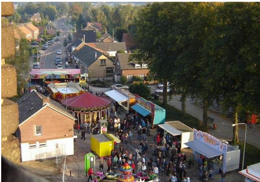
Beringse kermis, gezien vanuit de kerktoren. Oktober 2006 (foto G.B.)

Gezien het jaargetijde keren families in het vroeg ingevallen avonddonker naar hun eigen woonstee terug.