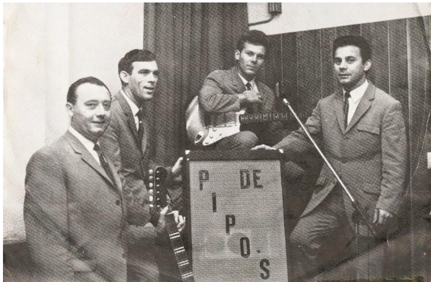
Orkest 'De 'Pipo's'

avonds gaan dansen. Een bijzonderheid: de mannen-wc bevond zich buiten het café en in een plasgoot kon je je overtollige vocht kwijt. Ook in de andere cafés was live – muziek en bij Antonius Steeghs, café 'Tontje', speelde het orkest "De Pipo's". De leden van dit orkest bleven bij 'Tontje' overnachten. Als ik mij goed herinner speelde bij Vios 'Lange Nelis'. 'Bruune Maantje' had in het pand, waar slagerij Korsten gevestigd was, een 'lunchroom' met de naam Juliana. Veel stelde het niet voor: hij had banken geplaatst in zijn winkel en op het vuur stond een ketel met vet te pruttelen. Daarin bakte hij frites. Lang heeft hij die lunchroom dan niet gehad."