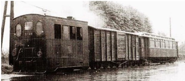
De tram in Beringe

"Op 1 september 1943 stapte ik om 7 uur op de tram te Beringe, een avontuur tegemoet, naar school in Venlo. Op de Tegelseweg lag de ambachtsschool, waar het timmeren geleerd moest worden. 's Avonds met de tram van 5 uur huiswaarts voor gezegd f 4,80