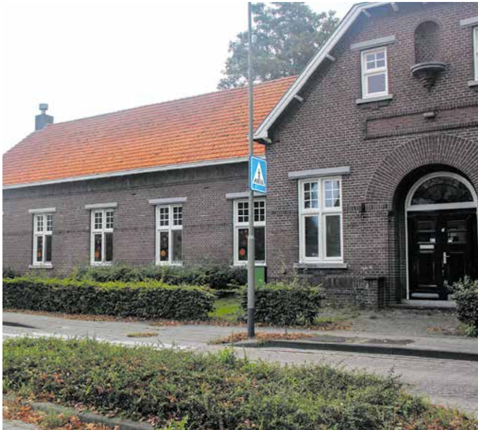
Nieuwe locatie basisschool De Pas