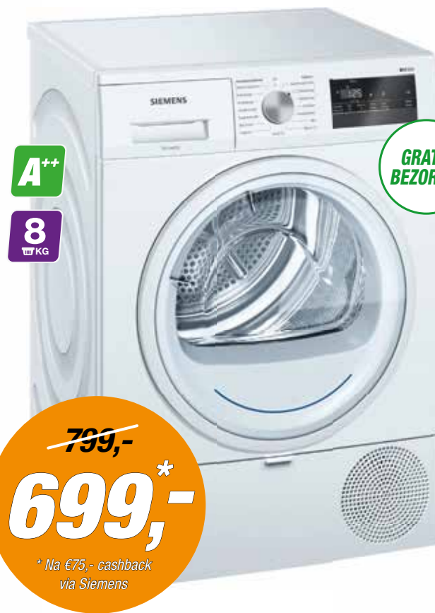
SIEMENS Wasdroger WT45W400NL