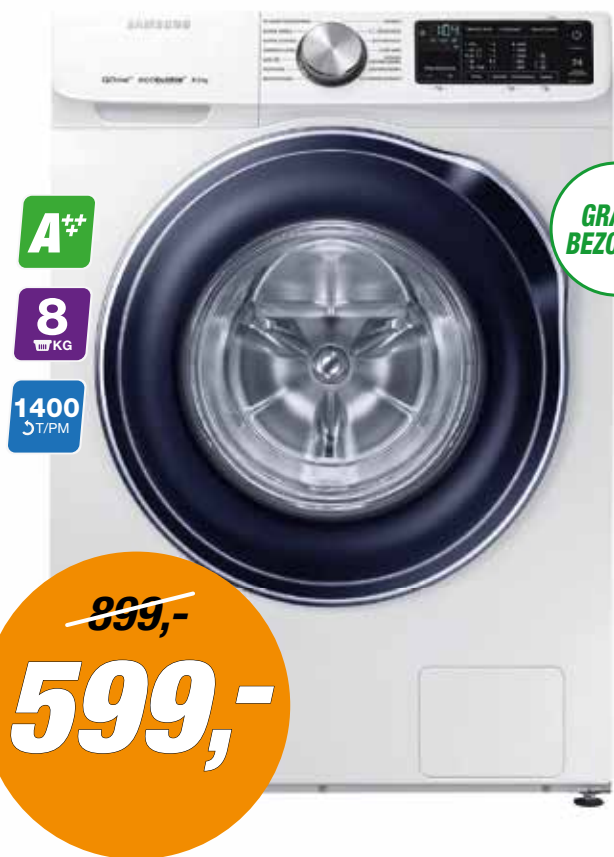
SAMSUNG Wasmachine WW8BM6420BW/EN