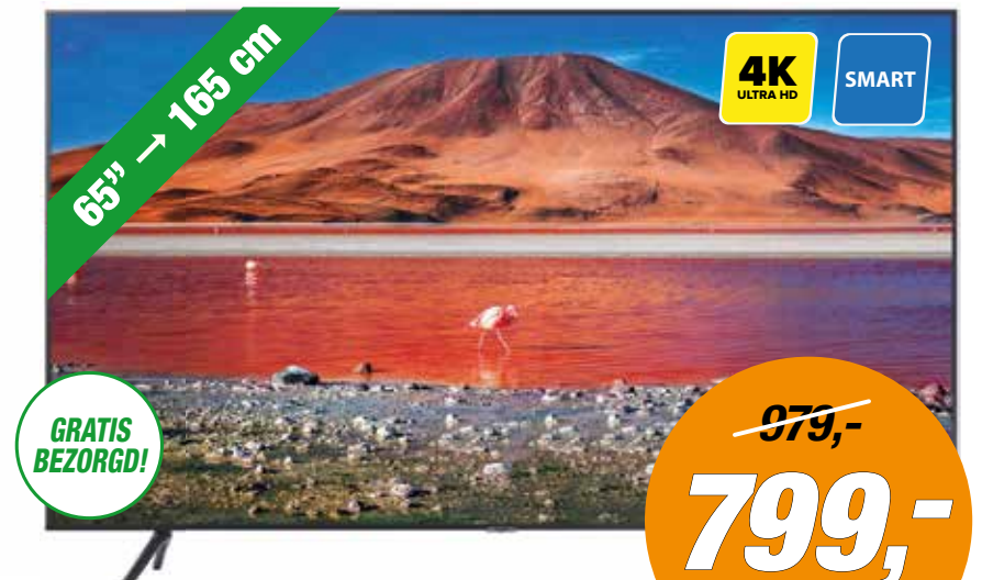
SAMSUNG 4K TV UE65TU7170SXXN