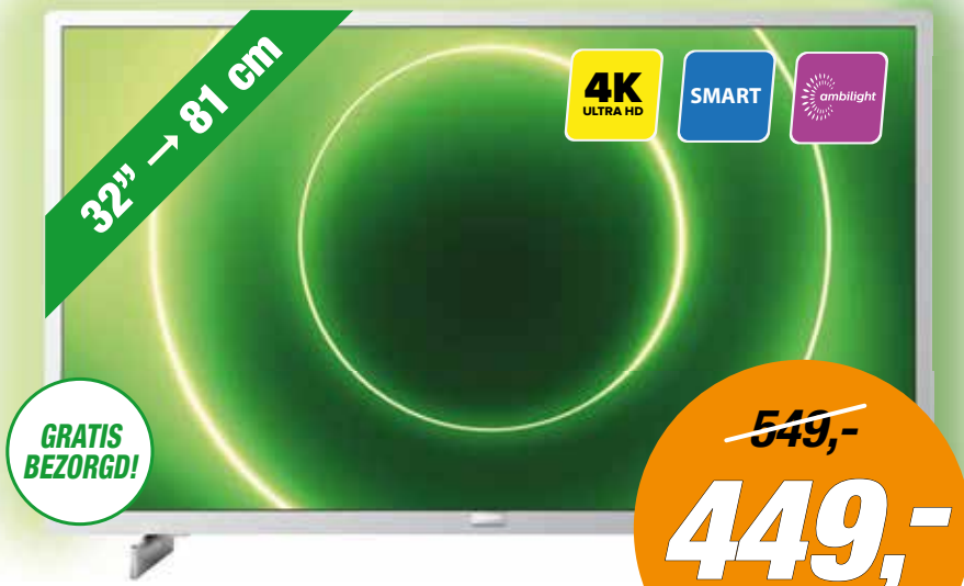
PHILIPS Full HD TV 32PFS6905/12